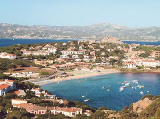
Unser Ferienort Baja Sardinia

Ausflug 3: Erleben Sie die Gallura, das Hinterland der Costa Smeralda von ihrer unbekannteren Seite. Vom bekannten Gigantengrab „Coddu Vecchiu“ fahren wir über Sant Antonio di Gallura nach Calangianus, dort werden wir zu einer Korkverarbeitungs-Führung erwartet. Weiter geht's durch die idyllischen Landschaften der Gallura mit ihren unzähligen Korkeichen und imposanten Granit-Felsformationen. Anschliessend verführen wir Sie auf Cristinas biologisch geführtem Bauernhof zu einem sardischen Imbiss mit hauseigenen Produkten und einem Glas Wein.