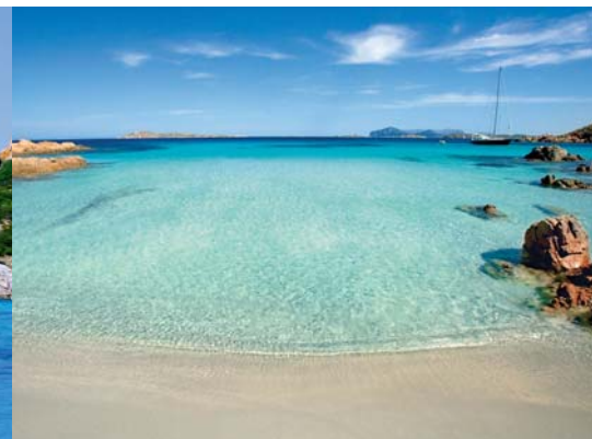
Traumstrände der Costa Smeralda