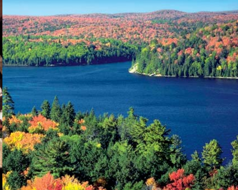
Alle Bilder dieses Folders sind urheberrechtlich geschützt.

den 83 m hoch sind und somit um 30 m höher als die der Niagara Fälle sind. Weiter geht es zu einem Besuch des Albert Gilles Copper Art Museums inklusive Führung (www.albertgilles-copper-art.com). Fahrt durch die pittoreske Landschaft mit Besuch einer Bäckerei (Chez Marie Bakery) die in 4. Generation seit 1652 in einem 150 Jahre alten Ofen Brot backt (Brotprobe mit Ahornsirupbutter inklusive). Im Anschluss daran besuchen Sie noch die Basilika Ste-Anne-de-Beaupré, die älteste katholische Kirche in Nordamerika und einer der bedeutendste Wallfahrtsort des Kontinents. Mehr als eine halbe Millionen Pilger kommen jährlich dorthin. (F)