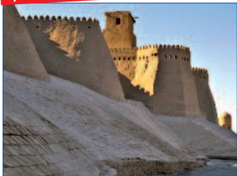
Die Stadtmauer von Chiwa