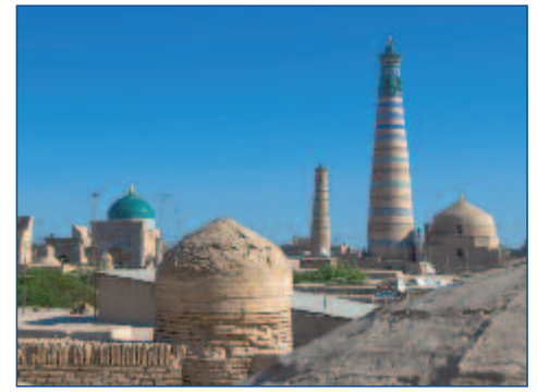
Das Minarett Islam Khodja in Chiwa