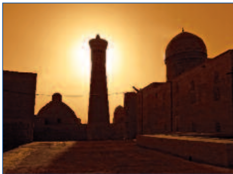
Sonnenuntergang über Bukhara