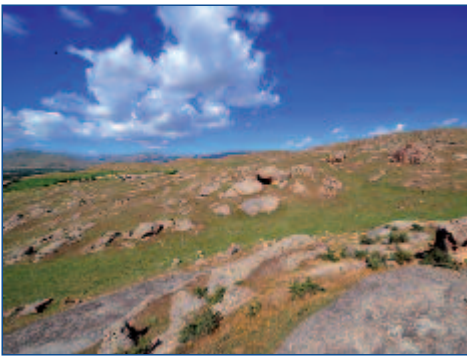
Ihre Reise führt Sie entlang grandioser Landschaften