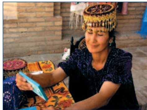
Traditionen werden bewahrt

10.05. BIS 17.05.2012 • FLUG AB/AN FRIEDRICHSHAFEN • AB € 1.395,- P.P. IM DZ