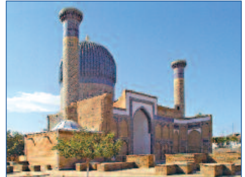
Gur Amir Mausoleum

S eit 2000 Jahren verbindet die sagenumwobene Seidenstraße China mit dem Abendland. Allein ihr Name weckt Träume von Karawanen, kostbaren Stoffen und orientalischen Gewürzen. Im einstigen Reich Dschingis Khans sind die Zeugen der Vergangenheit noch lebendig: Prachtvolle Bauwerke mit kunstvollen Ornamenten und Mosaiken prägen das Bild des antiken Samarkand, typisch islamische Architektur ist in Bukhara zu finden. Abseits der Städte fasziniert eine außergewöhnliche Landschaft. Verlassene Karawanseereien liegen in der großen Wüste Kizilkum, die von einem der längsten Flüsse Zentralasiens – dem Amudarja - begrenzt wird. Überall trifft man auf eine schier unglaubliche Gastfreundschaft! Noch ist die Seidenstraße ein Geheimtipp für Reisende. Entdecken Sie hier den unverfälschten Orient mit all seiner Magie und Mystik!