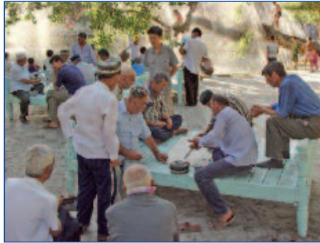
Orientalische Lebensart ...