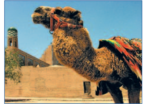
Transportmittel in der Wüste: Reitkamel

tur erbaut. Im Zentrum Bukharas spazieren Sie durch den großen Poi-Kalon Komplex mit Kalon-Moschee und Koranschule Miri-Arab. Mit 46 Metern Höhe ist das Kalon-Minarett als Wahrzeichen der Stadt weithin zu sehen. Wenig weiter wurden in den alten Handelsgewölben Taki Telpak Furoshon und Taki Saragon Juwelen und Hüte angeboten. Rund um das große Wasserbecken Labi Hauz im Zentrum können Sie sich in einem der zahlreichen Straßencafés erholen. Genießen Sie hier das orientalische Treiben rund um die Medrese Nadir Devon Begi – einer ursprünglichen Karawanserei. Inmitten eines traditionellen Wohngebietes besuchen Sie abschließend die Chor-Minor Moschee, eine Abwandlung des indischen Taj Mahal.