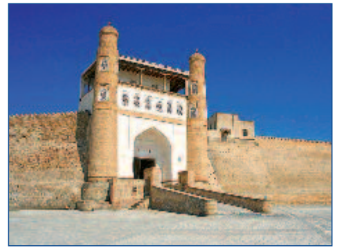
Die Ark-Festung in Bukhara