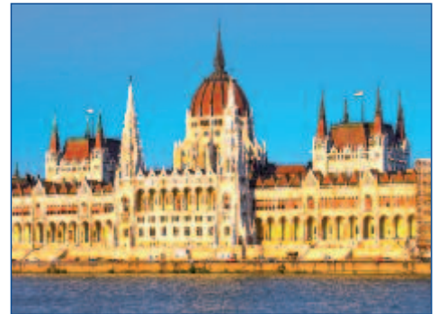
Das Parlament in Budapest im Abendlicht

09.09. BIS 15.09.2012 • AB/AN PASSAU • AB € 649,- P.P. IN DER 3-BETT-KABINE