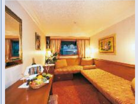
Kabinenbeispiel MS Rossini

artige Keramikmuseum Kovacs Margit bekannt ist. Anschließend fahren Sie weiter nach Visegrad. Vom Panoramaplateau in Visegrad genießen Sie eine herrliche Aussicht auf das Donauknie. Esztergom, Geburtsstadt des ersten ungarischen Königs, ist die nächste Station. Einschiffung in Esztergom und Weiterfahrt in Richtung Wien. Genießen Sie die erholsame Fahrt entlang der Donau und lassen Sie in aller Ruhe die herrliche Flusslandschaft an sich vorbeiziehen.