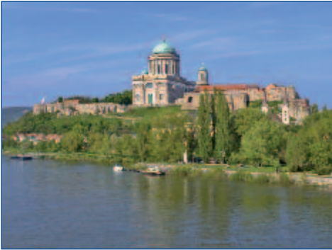
Die Basilika von Esztergom