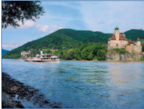
Schönbühel in der Wachau