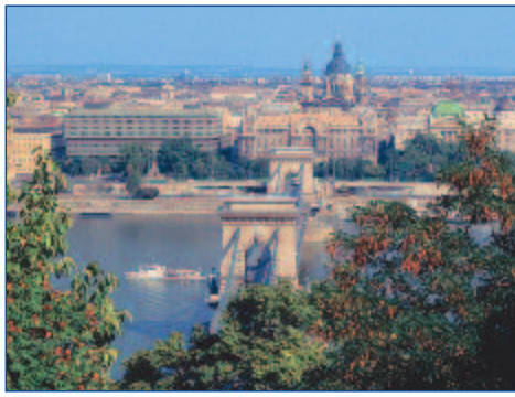
Die Kettenbrücke in Budapest