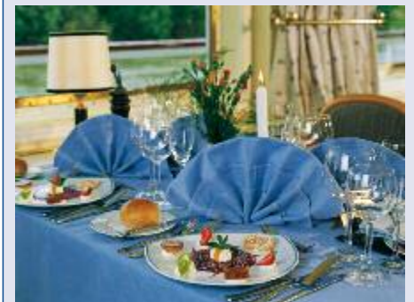
Gepflegte Mahlzeiten im Restaurant