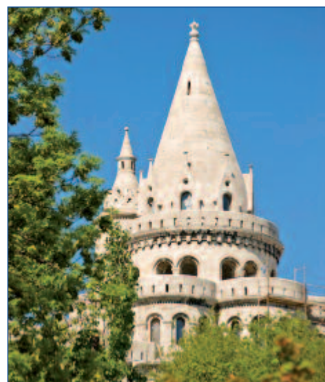
Budapest - die Fischerbastei