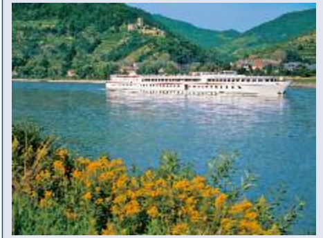
Das 🚢🚢🚢 Flussschiff „MS Rossini“