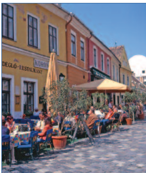
Szentendre: Die Stadt der Künste