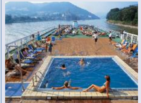
Am Pool der MS Rossini

In den Morgenstunden legt das Schiff in Passau an. Nach dem Frühstück erfolgt die Ausschiffung.