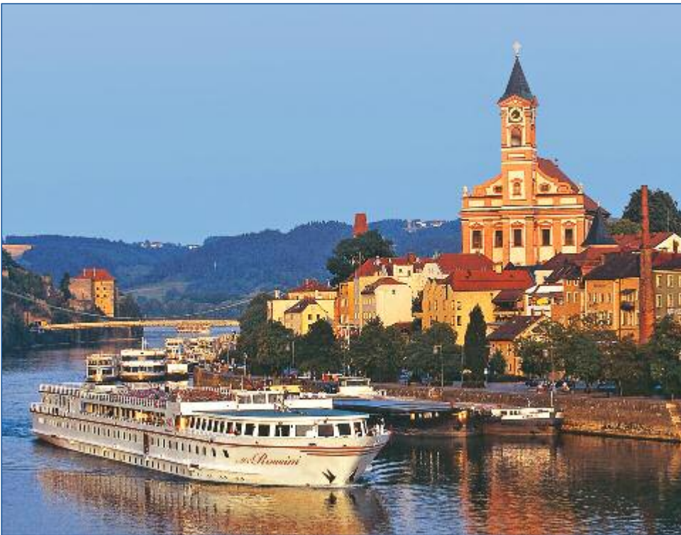
Die MS Rossini

E rleben Sie während dieser Reise von Passau nach Budapest eine einzigartige Mischung aus Stadt-, Land- und Flusslebens. Die „MS Rossini“, eines der größten Donauschiffe, fährt auf der Donau durch die zauberhafte Wachau, die bewaldeten Flussauen hinter Wien und die ungarische Tiefebene.