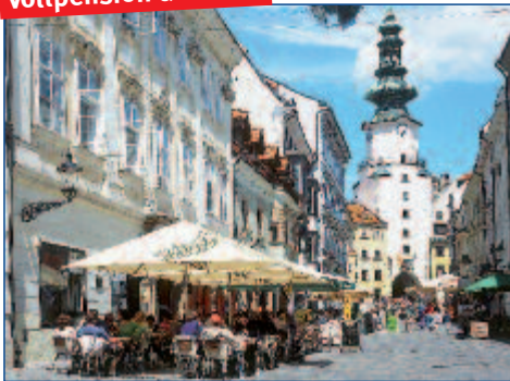
In der Altstadt von Bratislava