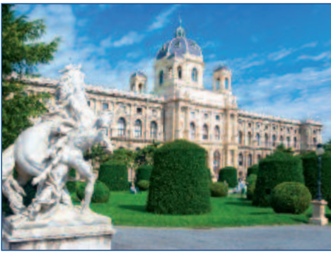
Die Hofburg in Wien