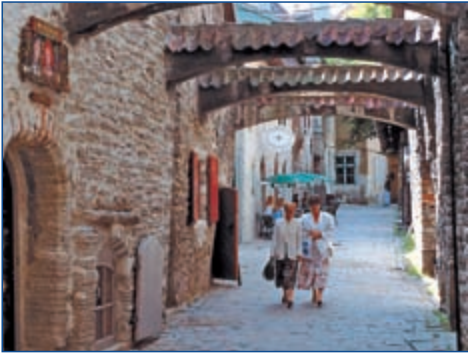
Gasse in der Altstadt von Tallinn