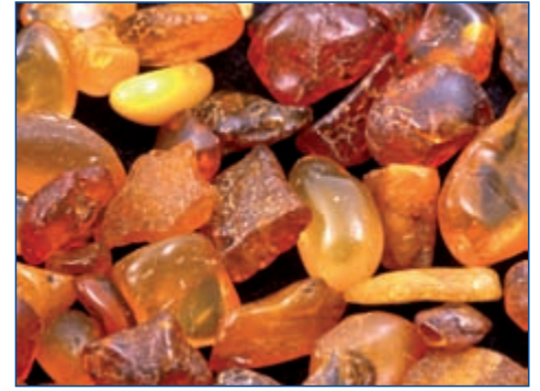
Bernstein, ein Schmuckstein aus fossilem Harz