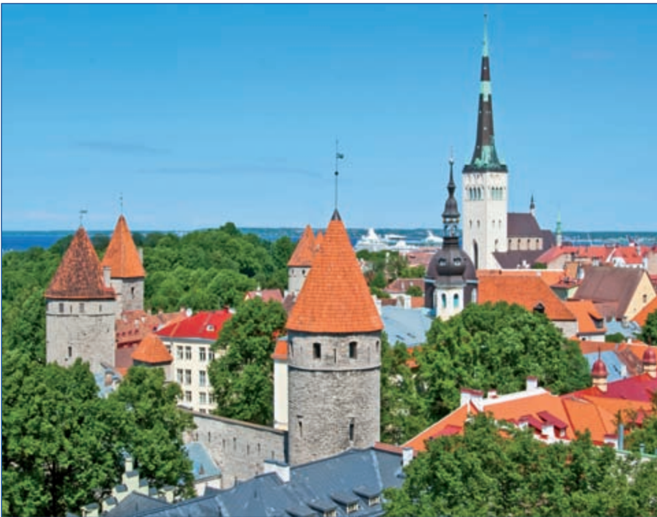
Blick über Tallinn

E ine Reise in das Baltikum ist eine spannende Entdeckungsreise. Kaum eine Region in Europa kann so viele Kulturdenkmäler auf so engem Raum vorweisen, selten ist die Natur so unberührt wie hier. Tallinn und Riga waren einst blühende Hansestädte; die schönen Altstädte zeugen noch heute vom Reichtum vergangener Tage. Die Altstadt von Vilnius, Litauens Hauptstadt, umfasst allein 300 Hektar und ist mit Barockkirchen geradezu übersät. In den Küstenorten Litauens und Lettlands können Sie an Ostseestränden Bernstein suchen. Die landschaftlichen Reize der Baltischen Staaten und der Kurischen Nehrung sind vielfältig und oft so einmalig, dass sie wie ein Kaleidoskop schöner Erinnerungen am Ende der Reise unvergänglich bleiben.