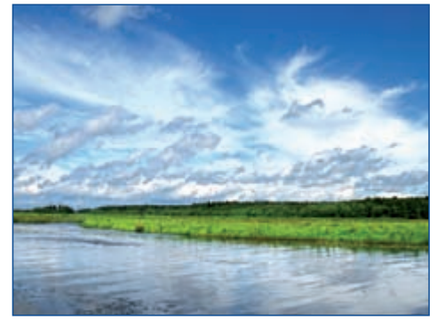
Der Zauber unberührter Landschaften