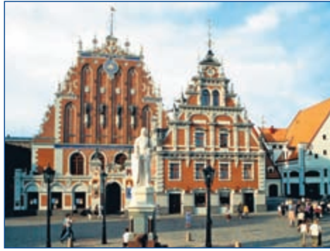
Schwarzhäupterhaus und Rolandstatue in Riga