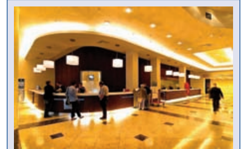
Lobby des Radisson Blu Hotel Latvija

Transfer zum Flughafen und Rückflug nach Deutschland.