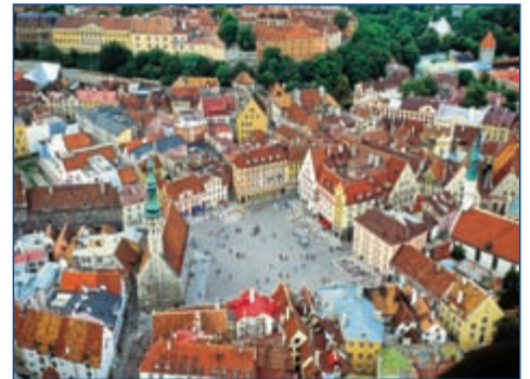
Der Rathausplatz von Tallinn

17.05. BIS 24.05.2012 • FLUG AB/AN FRIEDRICHSHAFEN • AB € 1.195,- P.P. IM DZ