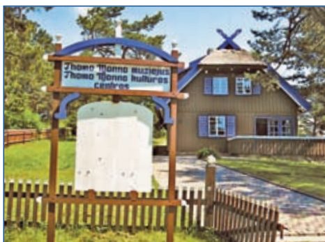
Das Thomas-Mann-Haus in Nida in Litauen

Stand: Sept. 2011, Änderungen vorbehalten.