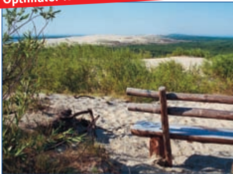
Die vielfältige Natur der Kurischen Nehrung