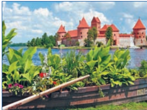
Die Wasserburg von Trakai