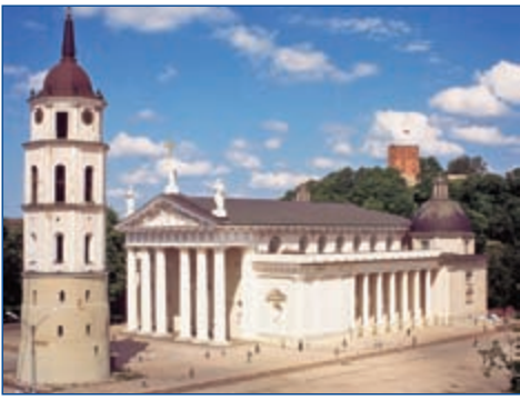
Die Kathedrale St. Stanislaus in Vilnius