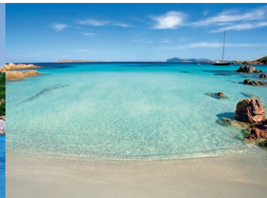
Traumstrände der Costa Smeralda