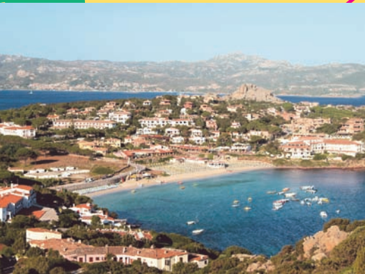
Unser Ferienort Baja Sardinia

Ausflug 3: Erleben Sie die Gallura, das Hinterland der Costa Smeralda von ihrer unbekannteren Seite. Vom bekannten Gigantengrab „Coddu Vecchiu“ fahren wir über Sant Antonio di Gallura nach Calangianus, dort werden wir zu einer Korkverarbeitungs-Führung erwartet. Weiter geht's durch die idyllischen Landschaften der Gallura mit ihren unzähligen Korkeichen und imposanten Granit-Felsformationen. Anschliessend verführen wir Sie auf Cristinas biologisch geführtem Bauernhof zu einem sardischen Imbiss mit hauseigenen Produkten und einem Glas Wein.