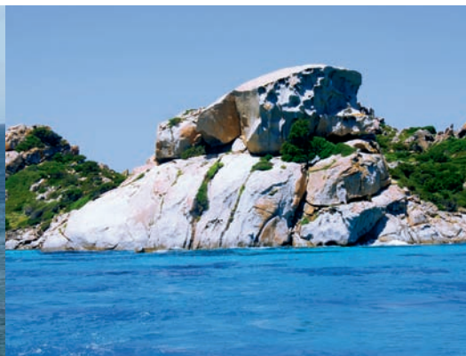
... vorbei an vielen Granitformationen