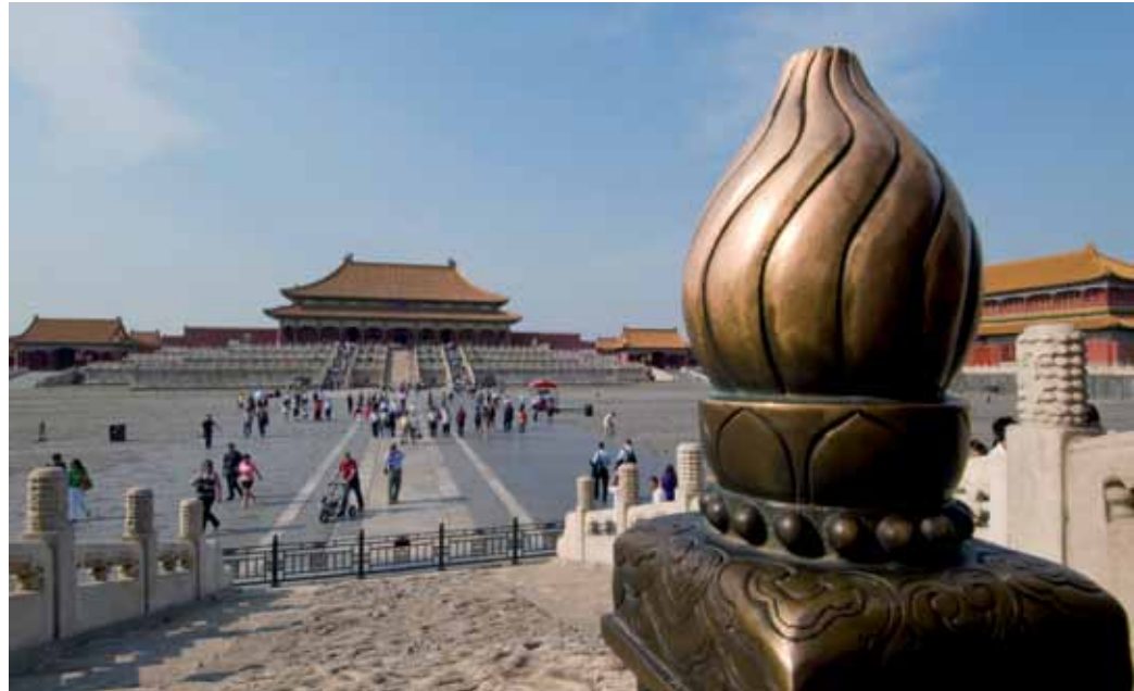
Verbotene Stadt in Peking