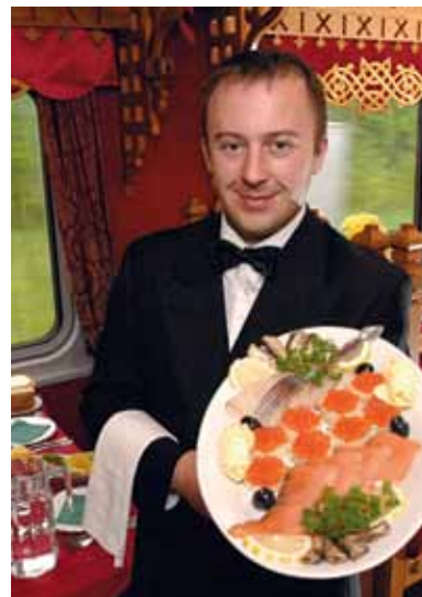
Kaviar- und Wodka-Probe

Ihre Mahlzeiten nehmen Sie bequem in stilvoll eingerichteten Speisewagen ein. Auch außerhalb der Mahlzeiten steht Ihnen der Speisewagen für einen Aufenthalt zur Verfügung. Unsere Chefköche in der Bordküche werden Sie verwöhnen.